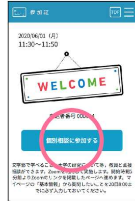
スワイプ後の画面